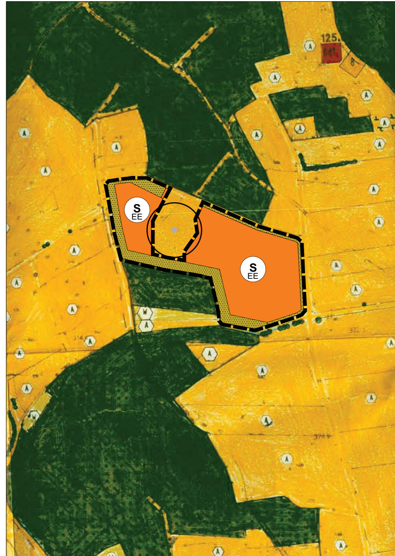
Kartengrundlage: Flächennutzungsplan mit integriertem Landschaftsplan, Scan