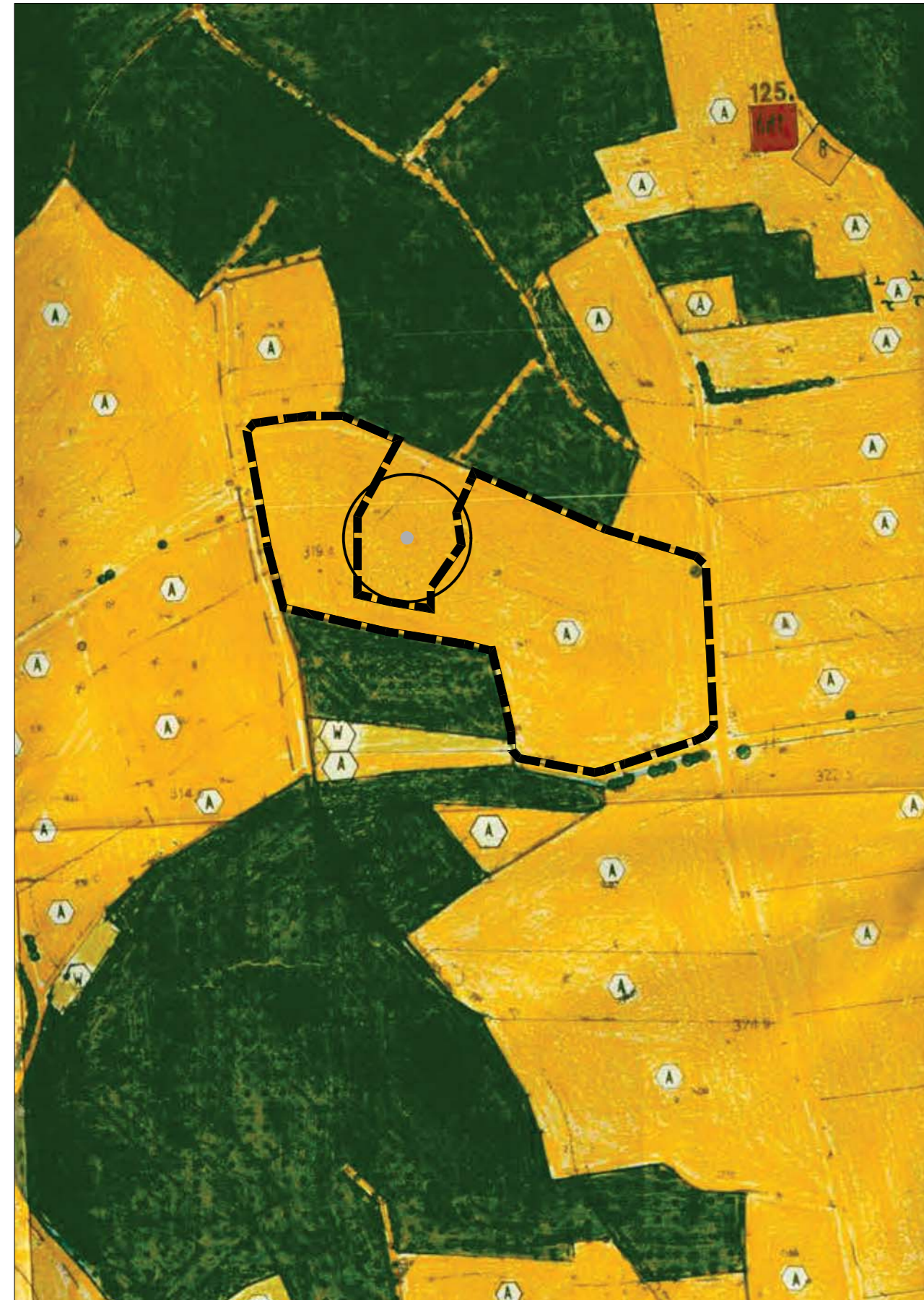
Kartengrundlage: Flächennutzungsplan mit integriertem Landschaftsplan, Scan